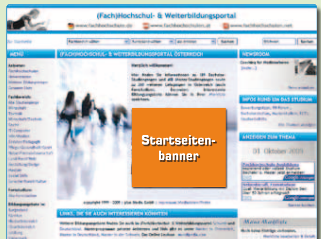
Startseitenbanner im (Fach)Hochschul- & Weiterbildungsportal

Länder: Deutschland - www.postgraduate.de Österreich - www.postgraduate.at Schweiz - www.postgraduate.ch