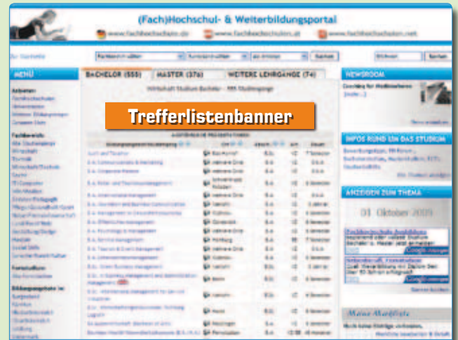
Trefferlistenbanner im (Fach)Hochschul- & Weiterbildungsportal