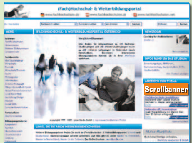
Scrollbanner im (Fach)Hochschul- & Weiterbildungsportal

Länder: Deutschland - www.fachhochschule.de Österreich - www.fachhochschulen.at Schweiz - www.fachhochschulen.net