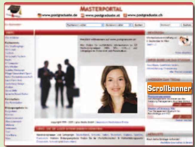
Scrollbanner im Masterportal